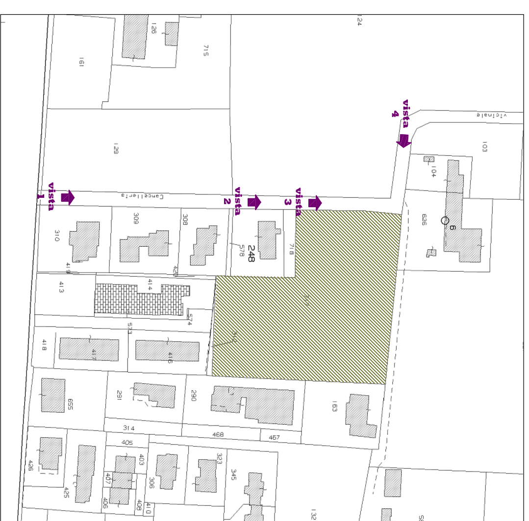
PUNTI DI VISTA