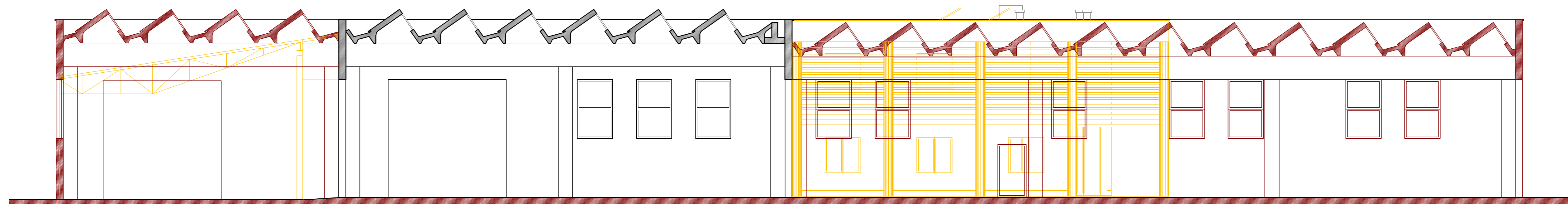
SEZIONE C-C, Scala 1:100